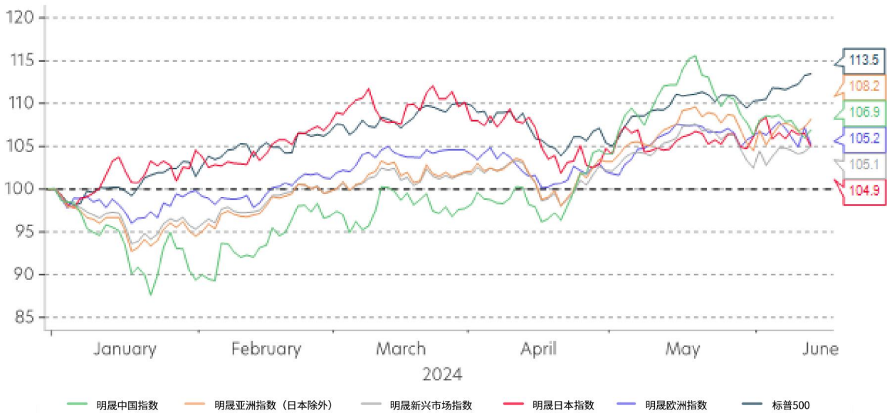
美元价格回报 (将 2024 年初设为基期=100)

虽然过去两年通胀率较为顽固，但预计将会下降。事实上，美国超级核心服务业通胀率比预期中更具粘性，服务业仍产生稳定的劳动力需求。然而，潜在趋势表明了美国劳动力市场正在降温，当前的职业空缺数与失业人数比例跌回了疫情前水平。在整体通胀率方面，劳动力市场出乎意料走强或通货膨胀升温可能会定期使得联邦基金期货对今年降息次数减少或不降息的情况进行计价。尽管如此，美国的政策利率倾向于下行。